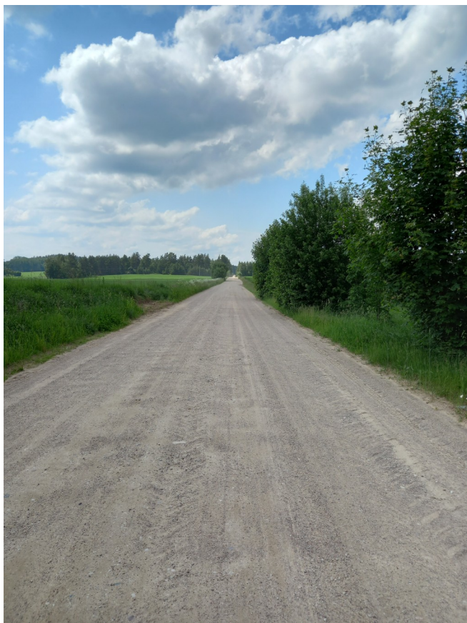
Droga Kamionka-Romejki przed przebudową

wsi Łękobudy, drogi gminnej Kamionka - Romejki, drogi gminnej Kamionka - Krzywa, drogi gminnej Kąty - Jasionóweczka) - dokumentacja projektowa". Wydatkowano 107 380,00 zł.