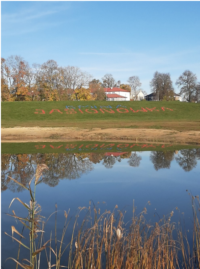
Wiosna nad Zalewem