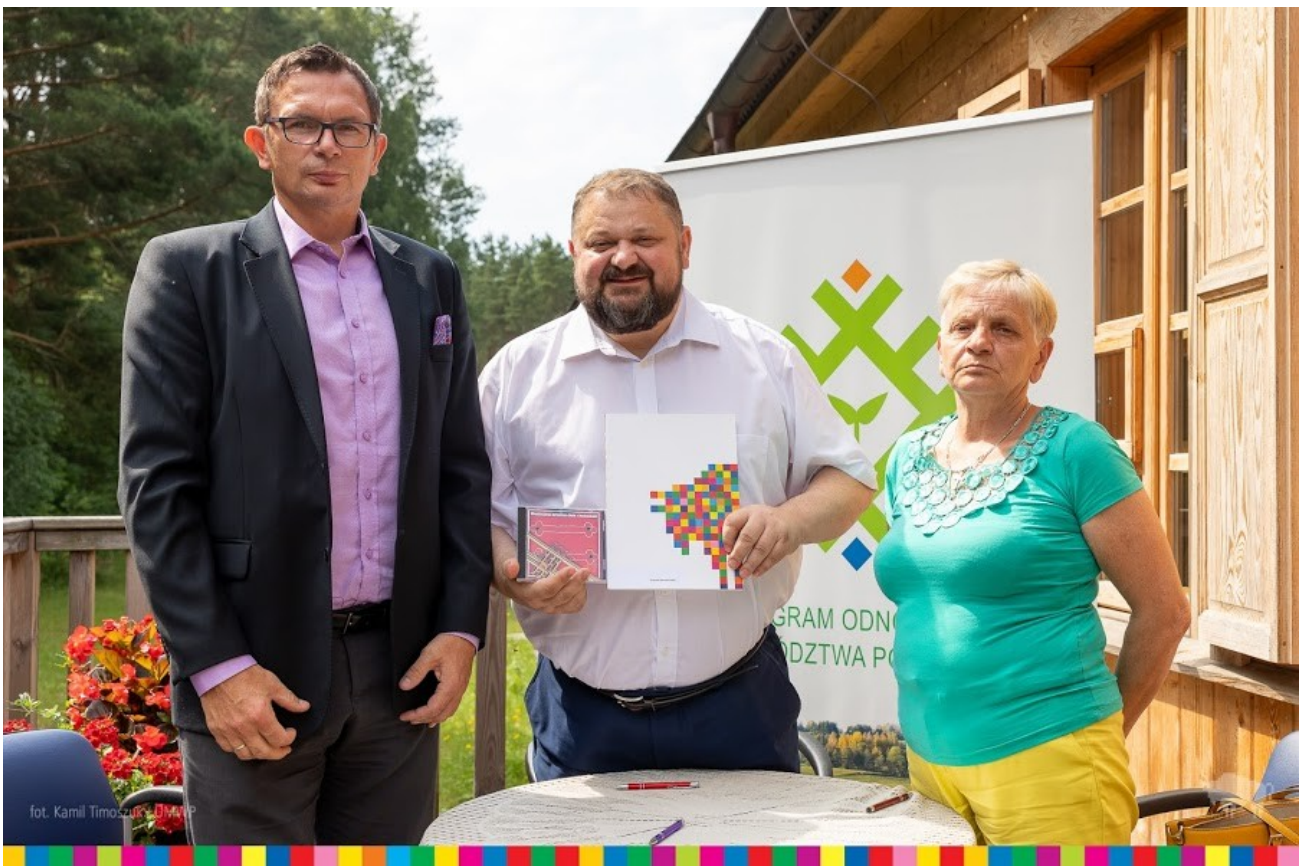
Podpisano umowę o dofinansowaniu zadania ze środków UMWP