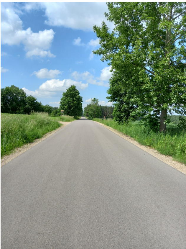
Droga Jasionówka-Słomianka zmodernizowana przez Powiat Moniecki