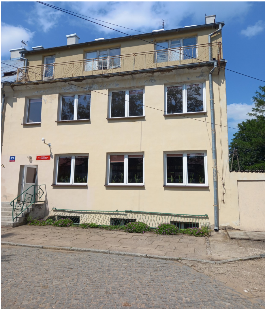
Budynek „Starej szkoły” przed modernizacją