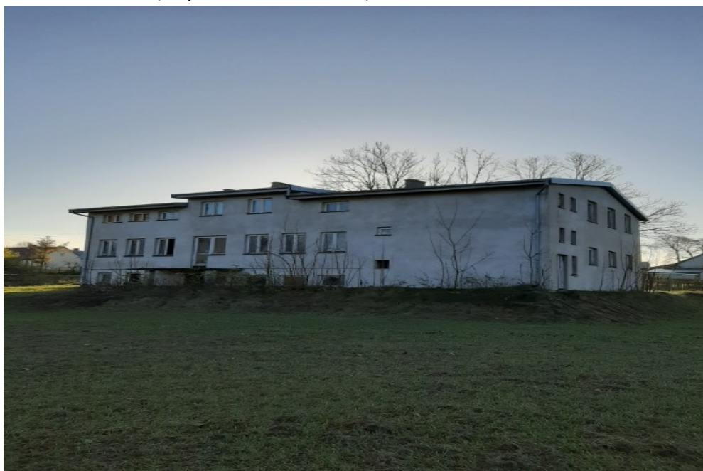
Budynek SUW Krasne Folwarczne przed modernizacją