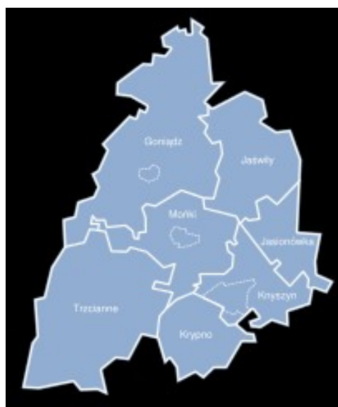
Gmina Jasionówka na mapie Powiatu Monieckiego