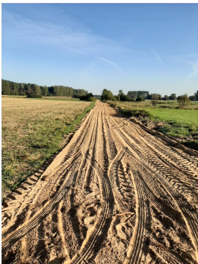
Droga w Czarnymstoku – zmodernizowana w ramach funduszu sołectkiego