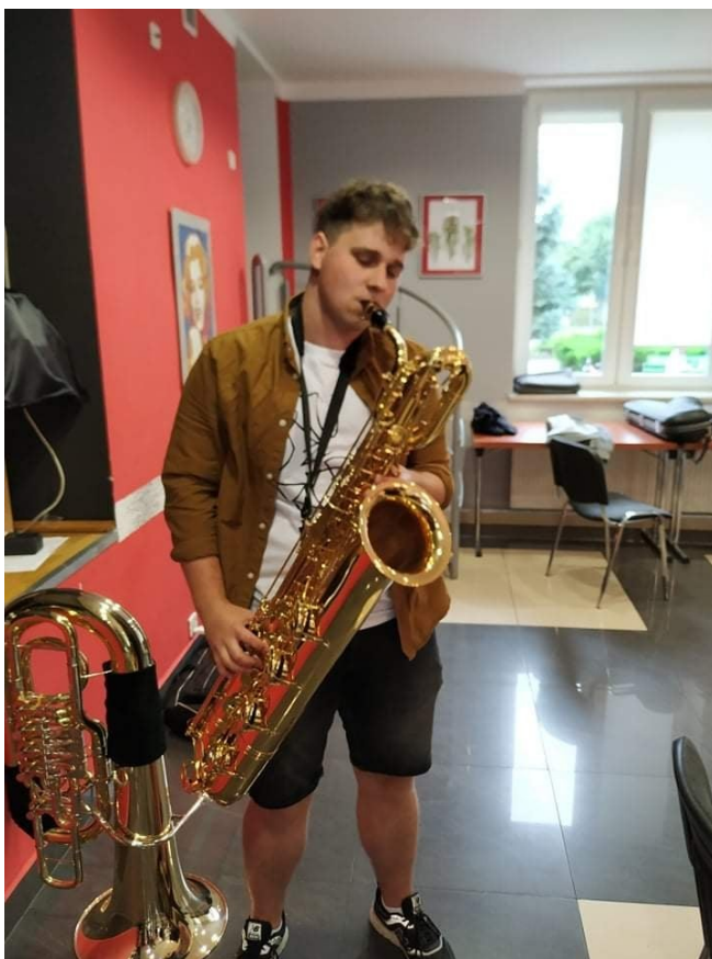
... i nowe instrumenty