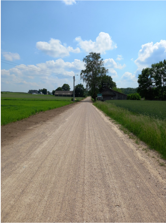
Droga w Kujbiedach przed przebudową