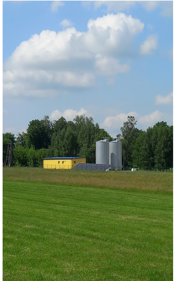
SUW Słomianka po modernizacji