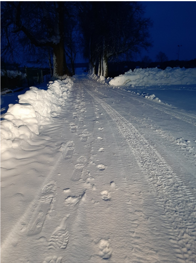
Ubiegłoroczna zima dała się wszystkim we znaki ... ale za to krajobraz mieliśmy przepiękny