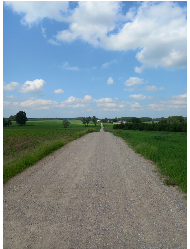
Droga Kamionka-Krzywa przed przebudową