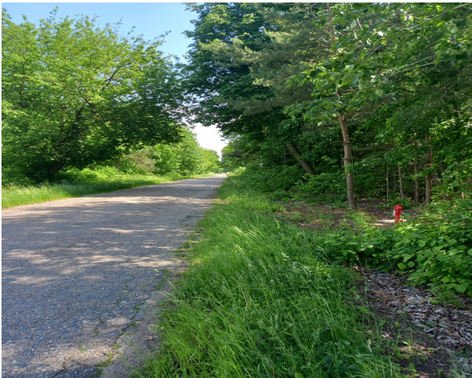
Odcinek sieci wodociągowej w Jasionóweczce