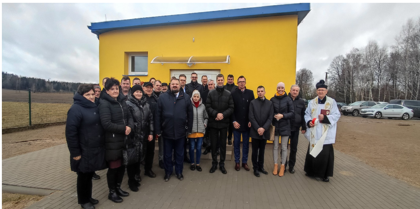
Odbiór inwestycji „Rozbudowa systemu zaopatrzenia w wodę i oczyszczania ścieków w Gminie Jasionówka”