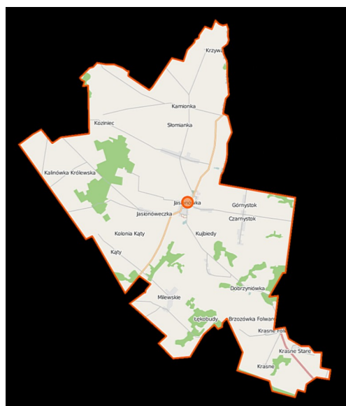
Mapa Gminy Jasionówka