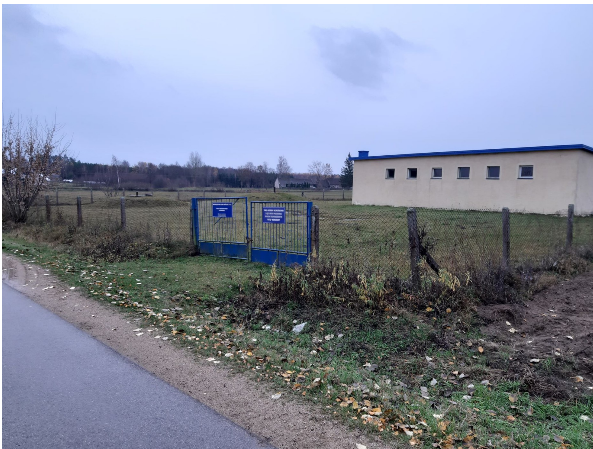
SUW Słomianka przed modernizacją