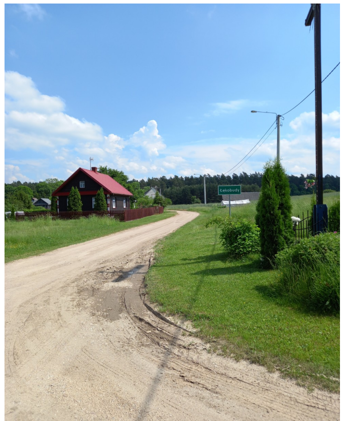
Droga w Łękołubdach przed modernizacją