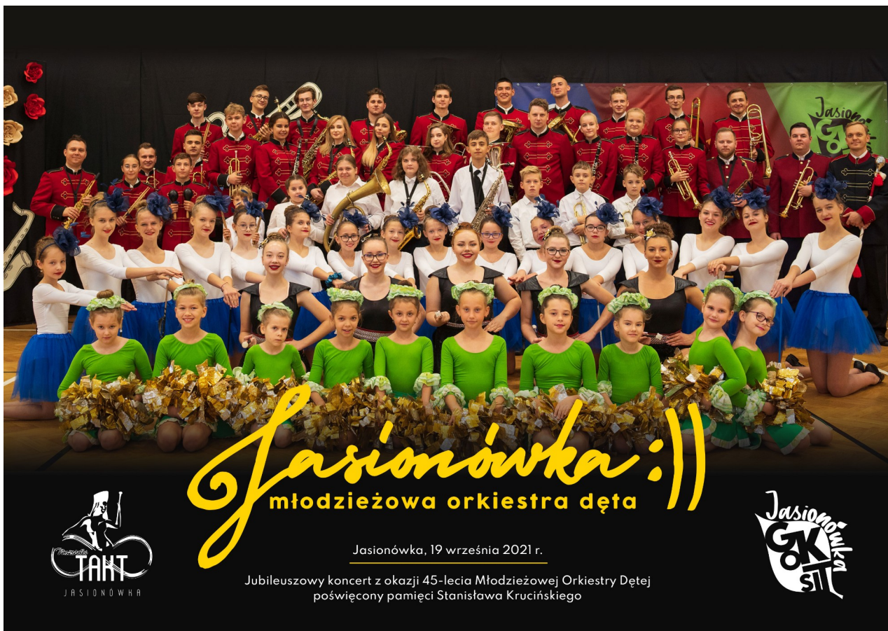
Młodzieżowa Orkiestra Dęta wraz z Mażoretkami ...