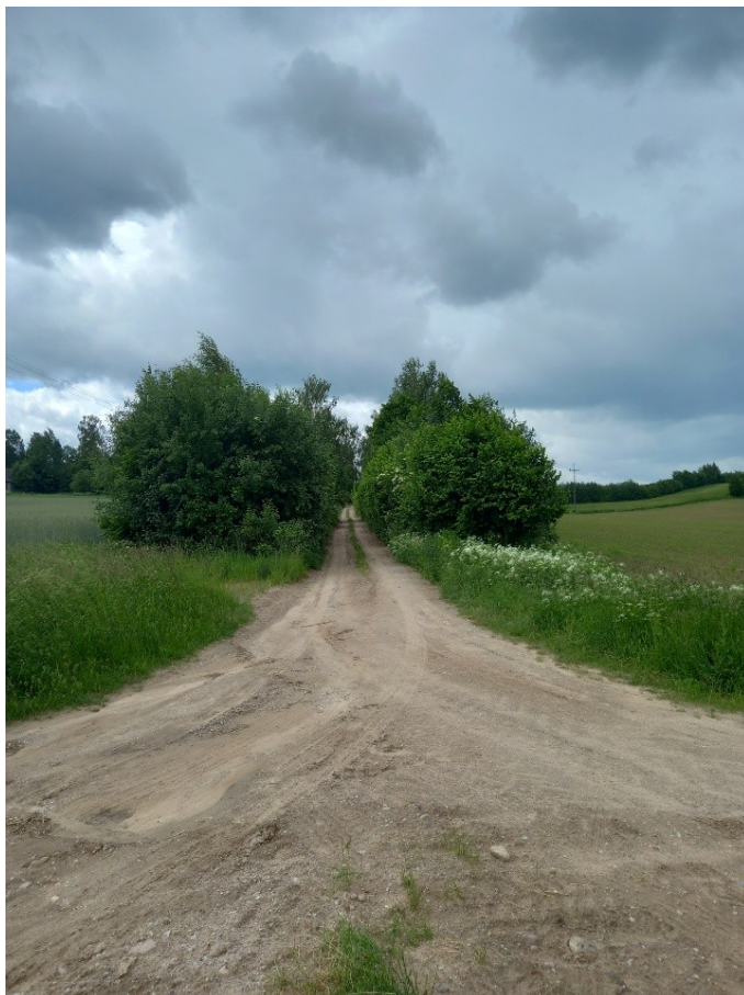
Droga przed modernizacją