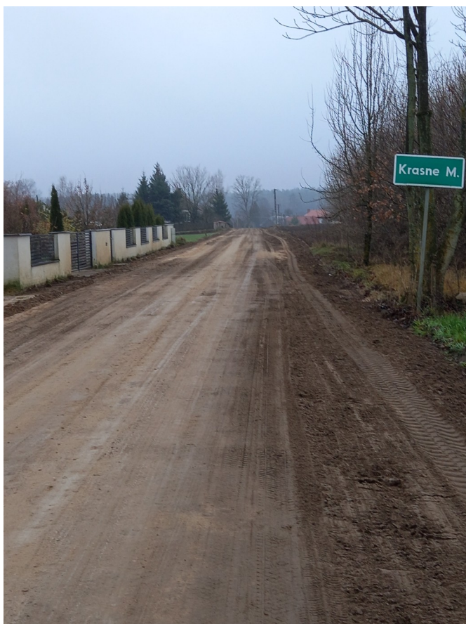
Droga Krasne Małe w trakcie modernizacji