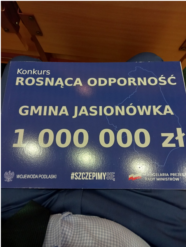
Nagroda za wzrost odsetka zaszczepionych przeciwko COVID-19