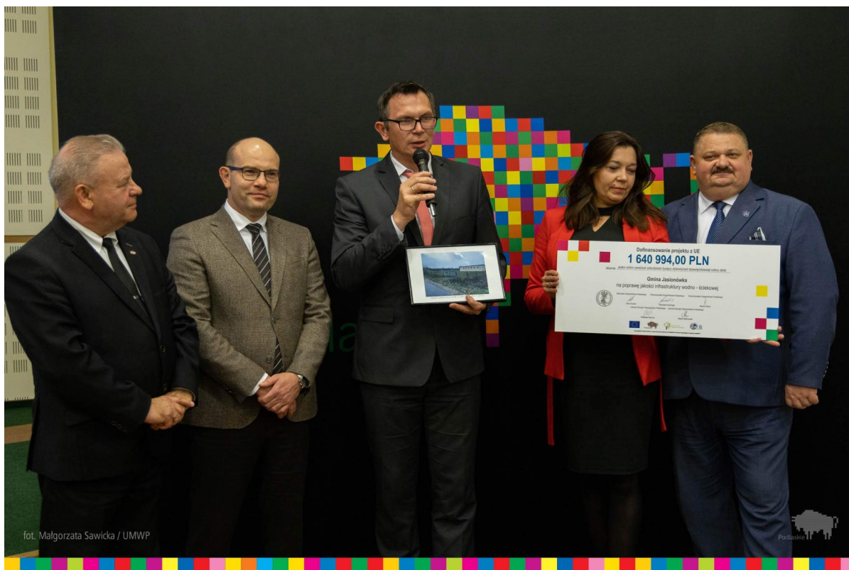
Gmina otrzymała dofinansowanie ze środków PROW 2014-2020