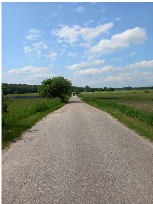
Droga Krasne Folwarczne-Łękobudy przed przebudową