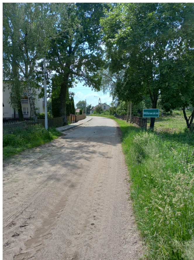
Wykonano chodnik we wsi Milewskie