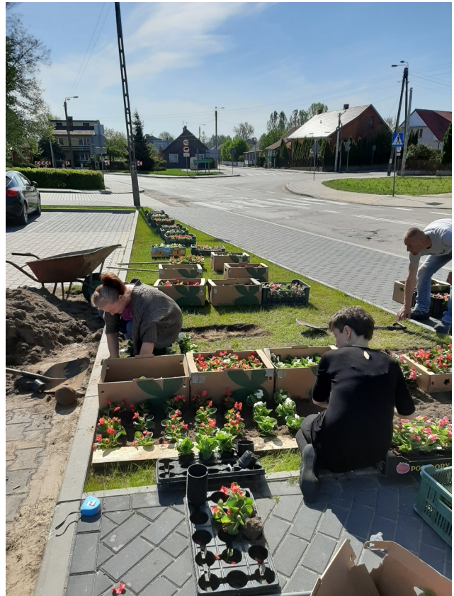
Zadbano o estetykę centrum Jasionówki