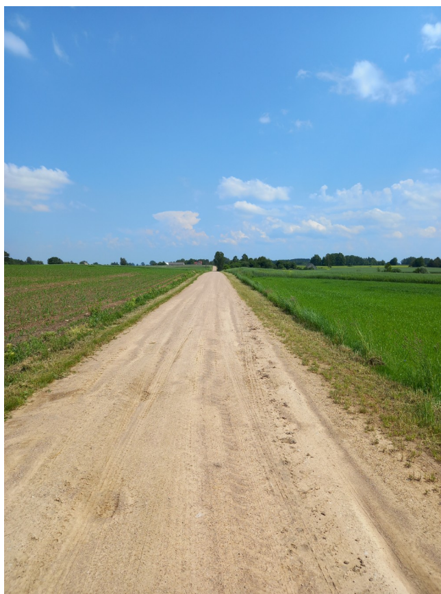
Droga Kąty-Jasionóweczka przed przebudową