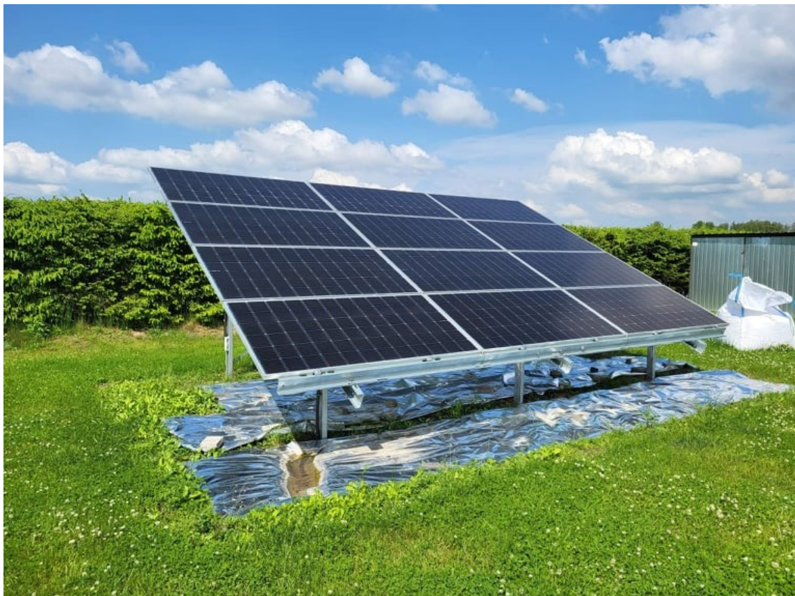
Jedna z instalacji zamontowanych w ramach projektu