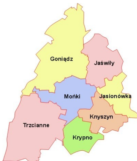
Rysunek 1. Gmina Jasionówka na tle powiatu monieckiego

Gmina Jasionówka położona jest w województwie podlaskim, w powiecie monieckim. Oddalona jest od Białegostoku o około 33 km oraz od Augustowa o około 60 km, dlatego też pozostaje w obszarze bezpośrednich wpływów obu miast (społecznych, ekonomicznych, rekreacyjnych i infrastrukturalnych). W skład gminy wchodzi 18 sołectw, zaś terytorium gminy obejmuje obszar 97 km 2 .